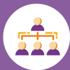
figure analoghe nelle scuole del territorio; • Formarsi adeguatamente sui protocolli di prevenzione e controllo in ambito scolastico e sulle procedure di gestione dei casi Covid-19 sospetti o confermati; • Comunicare al DdP numero elevato di assenze di studenti ed insegnanti; • Agevolare attività di Contact Tracing; • Informare e sensibilizzare il personale scolastico sui comportamenti da adottare.